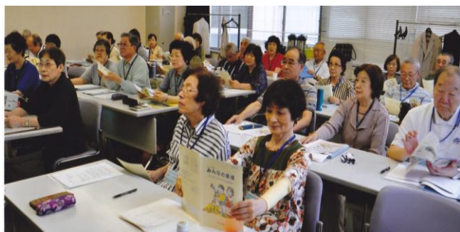
みんなの環境 興味深く学んでいます

世界の人口は30年後には90億人を超え大気汚染や水不足、食糧不足、森林破壊など、環境問題が深刻化すると予見されています。男女35名の研修生はそのような事態に備えて、地球温暖化や廃棄物処理、エネルギー事情、水環境への取り組みなどを学習し、何をなすべきかを考え、行動を起こすきっかけにしたいと考えています。