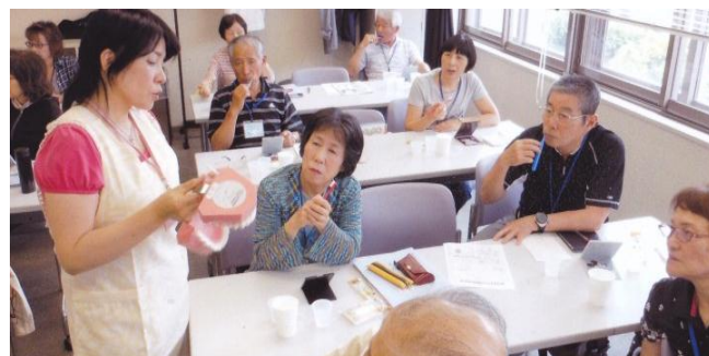
口腔ケアの実践教室

これから先も、更にチームワークを結集する「大学祭」や、授業では明るい心づくり、健康づくりの「公園散策」などが予定されており、1週間が待ち遠しい今日この頃です。